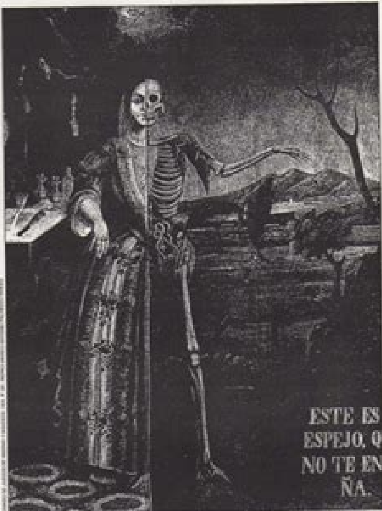
El espejo de la vida o vándalo es un ejemplo de pintura mural del tema de simbolismo, en la que la mano de Dios corta el hilo de la vida. Tonda Mondragón, Alegoría de la Muerte, 1898. Pinacoteca de La Profesa, ciudad de México.

Historia de la iconografía de la muerte católica, desde el medioevo hasta la reutilización de su imagen como Santa Muerte entre los creyentes de este rito popular en México. Se demuestra que cada vez que la muerte real se apodera de las calles y casas, la imagen de la muerte sale de su escondite y exige su culto.